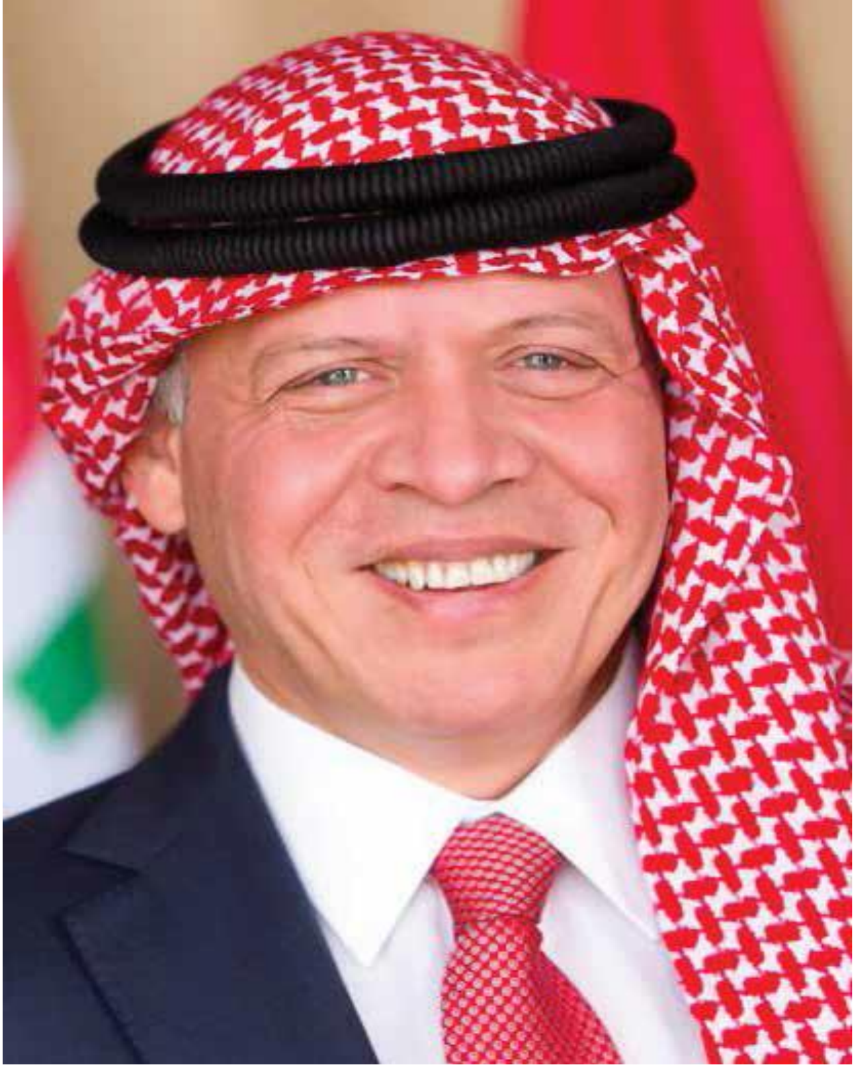
حضرة صاحب الجلالة الهاشمية الملك عبدالله الثاني بن الحسين المعظم (حفظه الله)