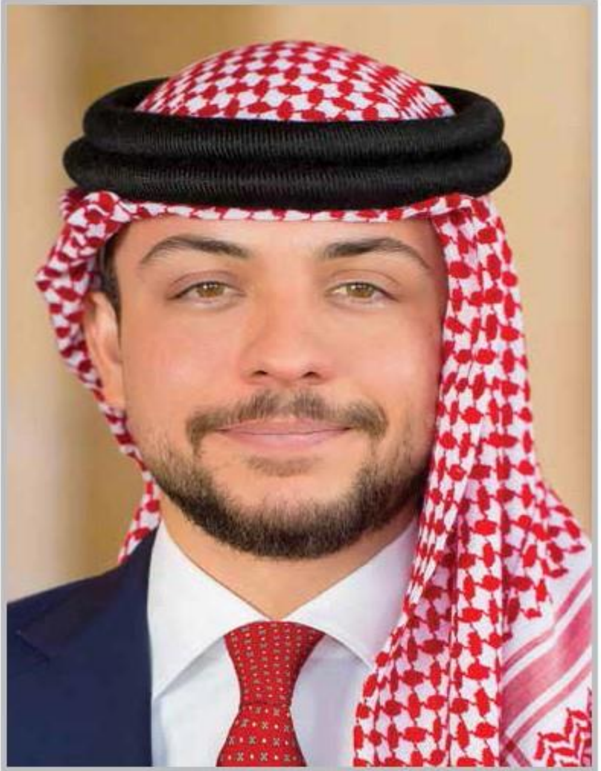
حضرة صاحب السمو الملكي ولي العهد الأمير الحسين بن عبدالله الثاني المعظم